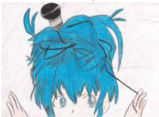
Rysunek wykonała: Klaudia Sadzikowska

Skłania głowę nisko, aż do pasa. Tylko po co? – pytam. Po co? Myśli, że nie widzę, ale ja patrzę. Wewnętrzne oko nadziwić się nie może Dzień dobry – mówi. Później prowadzi na rozstrzelanie. Mówią, że wojny nie ma. Dla mnie ona wciąż istnieje. Wyzywa, obraża, poniża i ośmiesza. Nie można nauczyć kamieni pisać. - Pani profesor, czy może mi pani coś wytłumaczyć? - Naturalnie.